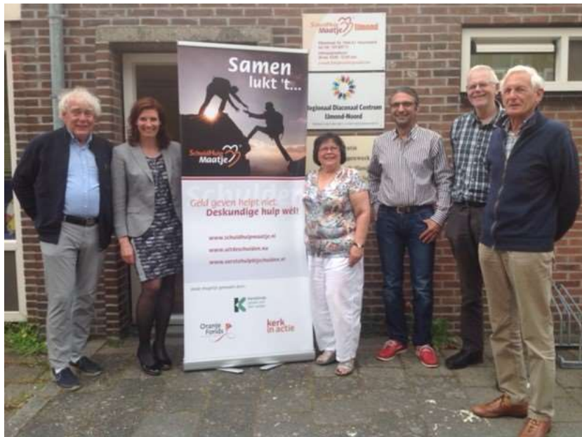
Enkele maatjes met enkele bestuursleden

De avonden worden bijgewoond door bestuursleden van de stichting. Hierdoor blijft het bestuur goed geïnformeerd over de gang van zaken in het veldwerk.