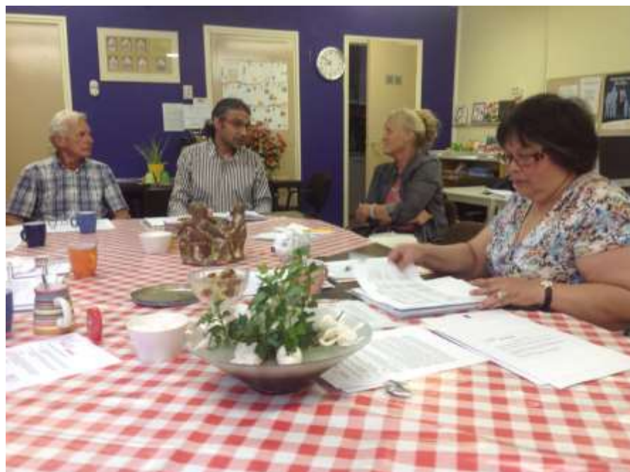
SHMaatjes in overleg met hun coördinator

Zie onze website http://www.maatjesvoorschuldhelpijmond.nl/